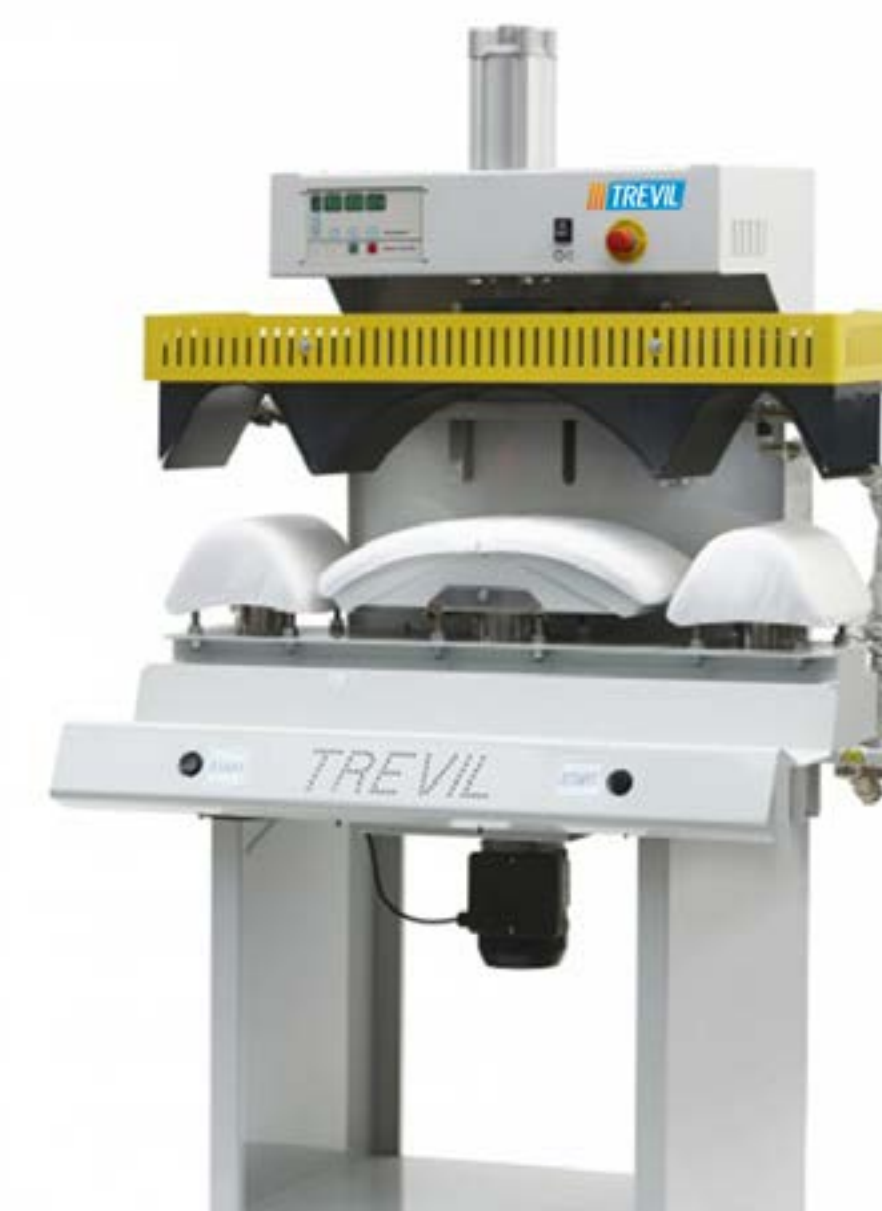
Pressa per colli e polsi