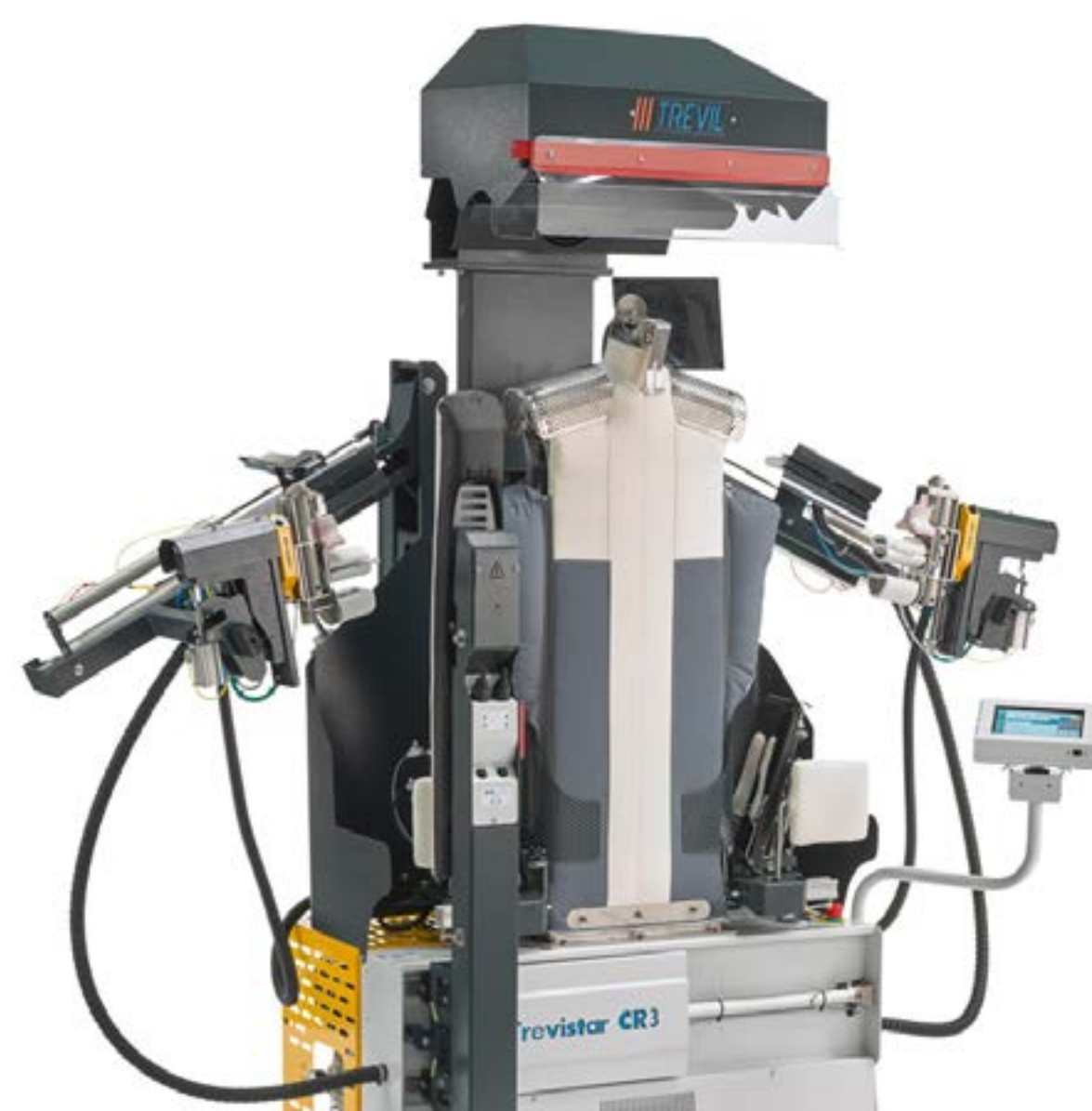
Stiracamicie soffiato premium