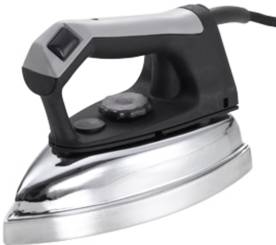
Ferro elettrovapore 800 W