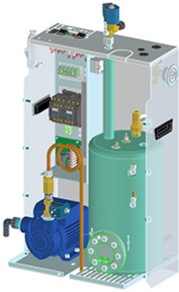
Caldaia 4 kW incorporata ad alimentazione automatica con pompa