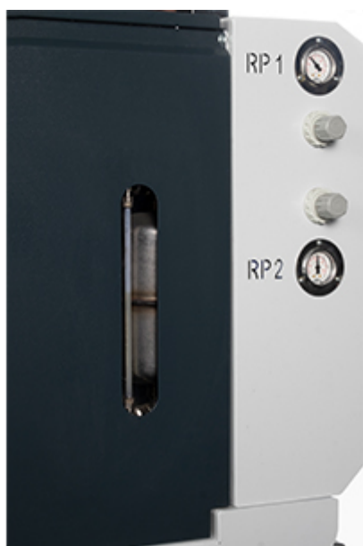
Indicatore di livello olio