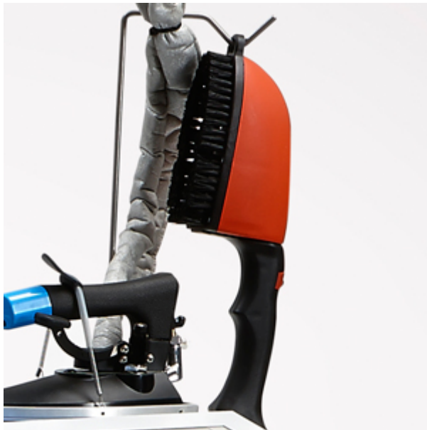
Spazzola vaporizzante con asta reggicavo