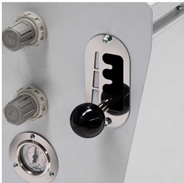
Regolazione manuale del soffiaggio (mod. 5142, 5152)