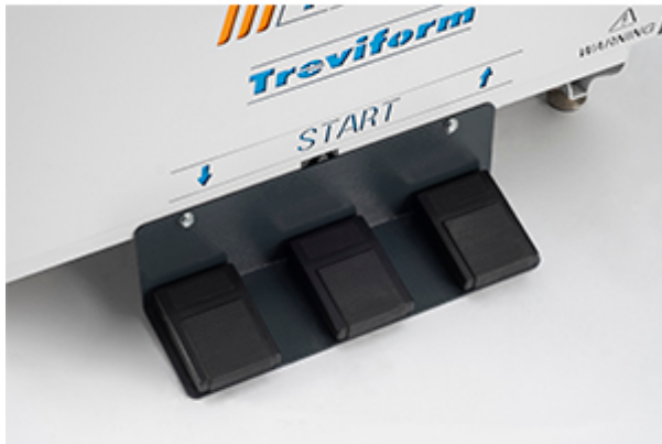
Comodi pedali di comando