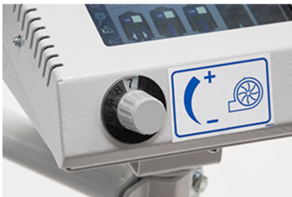
Regolazione elettronica del soffiaggio (mod. 5143, 5153)